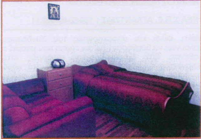
ΞΕΝΩΝΑΣ "ΖΩΗ" : Το εσωτερικό υπνοδωματίου

Μπορούν να φιλοξενηθούν ταυτόχρονα μέχρι 4 άτομα.