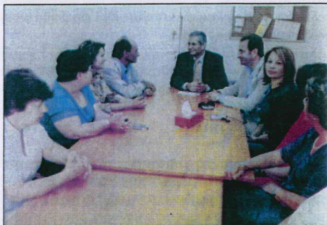
15.5.2006. Αντιπροσωπεία του ΑΚΕΛ με επικεφαλής το βουλευτή Άντρο Κυπριανού επισκέφτηκε τα Γραφεία μας

● Στις 15 Μαΐου 2006 κλιμάκιο του ΑΚΕΛ με επικεφαλής τον Άντρο Κυπριανού επισκέφθη τα γραφεία του Συνδέσμου και παρέδωσε εισφορά του κόμματος ύψους £1.000. Η εισφορά έγινε στα πλαίσια της απόφασης του ΑΚΕΛ το ποσό που θα διέθετε για προεκλογικούς σκοπούς να το διαθέσει σε φιλανθρωπικές Οργανώσεις. Με την ευκαιρία αυτή ενημερώθηκε το κλιμάκιο για τα διάφορα προβλήματα που αντιμετωπίζουν οι