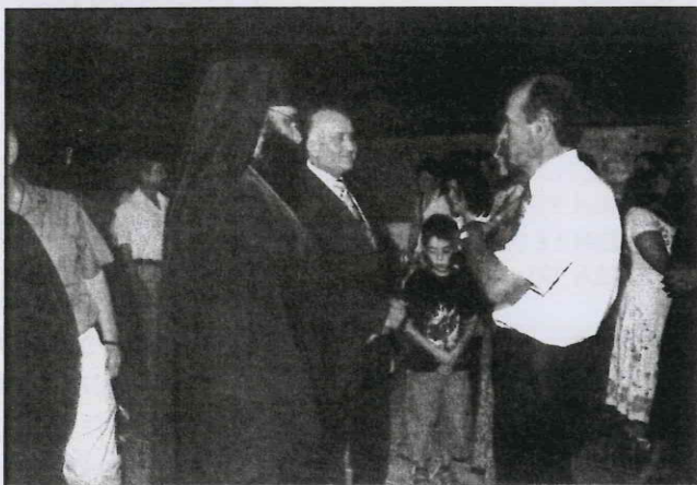
Στιγμιότυπο από τη δεξίωση κατά την τελετή των εγκαινίων.

Ένα άλλο χαρακτηριστικό ήταν η εκπροσώπηση οργανωμένων συνόλων κομμάτων, Οργανώσεων, Συνδέσμων.