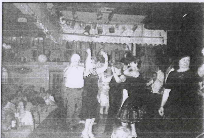
Διασκέδαση στην Πλάκα.

Στη διαδρομή θαυμάσαμε τη γέφυρα που ενώνει Ρίο-Αντίρριο. Στο μοναστήρι των Παπαροκάδων, μας υποδέχτηκαν με αγάπη, μας μίλησαν και εντυπωσιαστήκαμε από τις 62 καμπάνες και τα 400 σήμαντρα. Προσκυνήσαμε και στον Άγιο Νεκτάριο και άφιξη μέσο Λιβαδειάς στην Αθήνα. Η επόμενη μέρα ελεύθερη και τα μαγαζιά...στέναξαν.