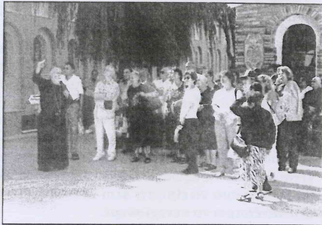
Τρίκορφο (Μονή Παπαροκάδων)

Κλείσαμε την εκδρομή με επίσκεψη στην Εύβοια και προσκύνημα στον Άγιο Ιωάννη το Ρώσο.