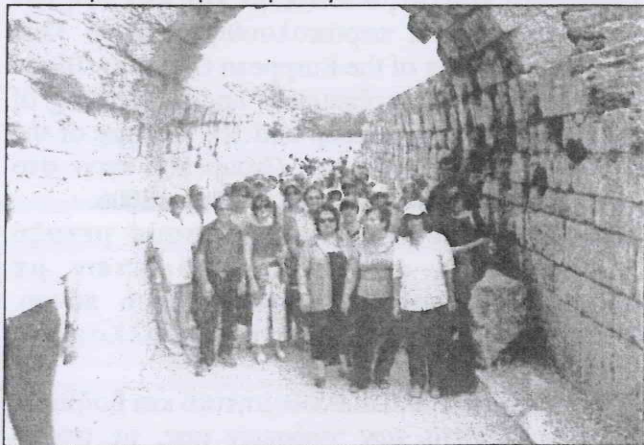
Ξενάγηση στην Αρχαία Ολυμπία.

Τα γράφουμε όπως μας τα έστειλε και δε θέλουμε κακοφανισμούς.