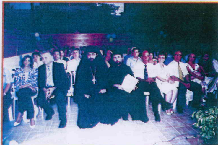
Ένα στιγμιότυπο από την τελετή των εγκαινίων

Είναι τα μέλη του Συμβουλίου και των επαρχιακών επιτροπών. Είθε ΕΣΕΙΣ τα μέλη και μη μέλη που στέκεστε δίπλα μας σε κάθε εκδήλωση, σε κάθε δράση. Είναι οι επώνυμοι και ανώνυμοι με τις χορηγίες και εισφορές τους. Σήμερα νιώθουμε περισσότερο αυτό που γράψαμε στο 1ο τεύχος: "Μακάριον το δίδοναι ή λαμβάνειν" Είμαστε δε ευτυχείς γιατί η απόκτηση οικήματος και η δημιουργία ΞΕΝΩΝΑ έγινε χωρίς να υποβαθμιστούν οι δραστηριότητες που αφορούν τους ασθενείς. Απεναντίας τα ποσά βοήθειας αυξήθηκαν, οι διάφορες εκδηλώσεις(εκδρομές, συνεστιάσεις, κλπ)γίνονται. Είμαστε αισιόδοξοι για το μέλλον. Με τη δική σας βοήθεια και συμπαράσταση θα προσφέρουμε περισσότερα.