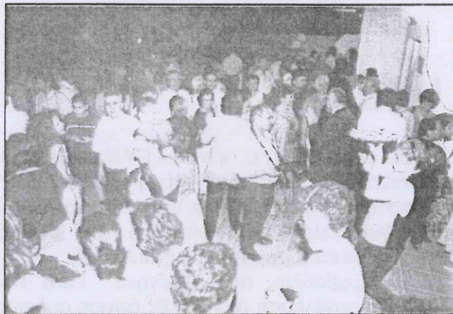
Στιγμιότυπο από τη δεξίωση κατά την τελετή των εγκαινίων.