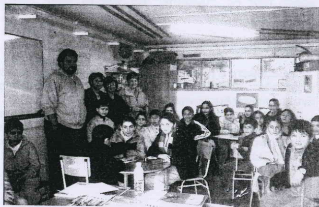
Οι μικροί οικολόγοι του Α' Δημοτικού Σχολείου Δαλιού. Στη φωτογραφία η αντιπροσωπία του Συνδέσμου και οι δασκάλοι τους.