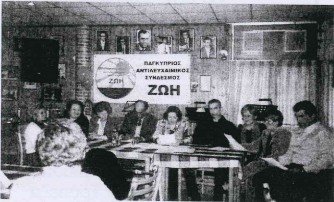
Το Δ. Συμβούλιο κατά την Ετήσια Γενική Συνέλευση που έγινε στις 30.1.2005

Για καλύτερη οργάνωση δημιουργήσαμε Επαρχιακά Γραφεία στη Λευκωσία, Λεμεσό, Πάφο και Λάρνακα. Με τα μέλη των Επαρχιακών