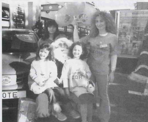
Στιγμιότυπο από τον οδικό έρανο.

Θα σταματήσουμε τη θεωρητικολογία και τη φιλοσοφική θεώρηση της δράσης του Συνδέσμου και θα έρθουμε στην καθ' αυτό λογοδοσία για την περασμένη χρονιά, που μέσα απ' αυτή θα δικαιολογηθεί και η όποια επιτυχία της δράσης μας και θα γίνει ένα έναυσμα για περαιτέρω δράση και νέα οράματα.