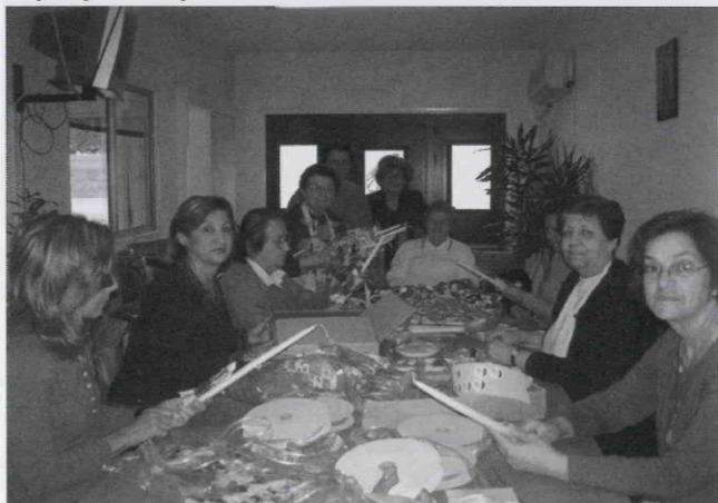
Ετοιμασία Λαμπριάτικων Λαμπάδων.

Ιδιαίτερες ευχαριστίες στην εταιρεία ΕΠΙΦΑΝΙΟΣ ΠΑΠΑΧΡΙΣΤΟΔΟΥΛΟΥ Λτδ .που μας διέθεσε δωρεά τις λαμπάδες.