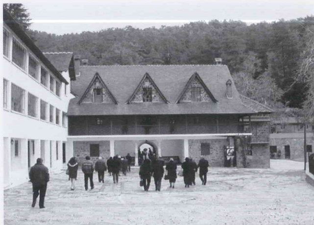
Διήμερη εκδρομή. Προσκύνημα στην Τροοδίτισσα.