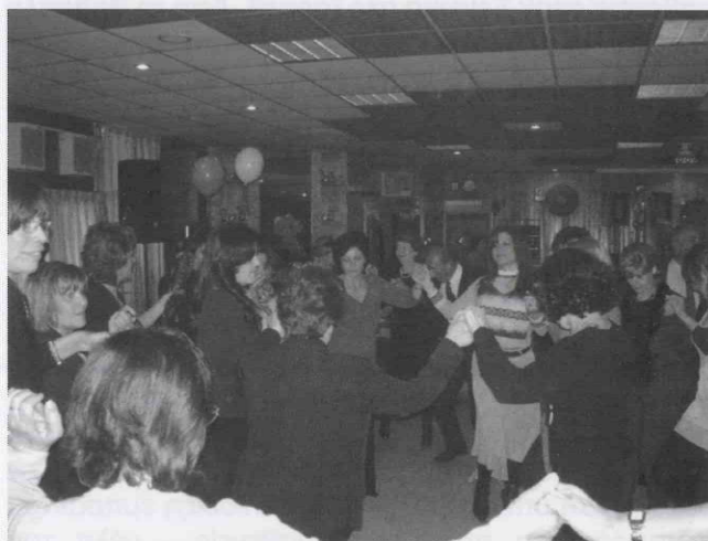
Συνεστίαση χωρίς χορό δε γίνεται.

Θερμές ευχαριστίες στους συντελεστές της εκδήλωσης.