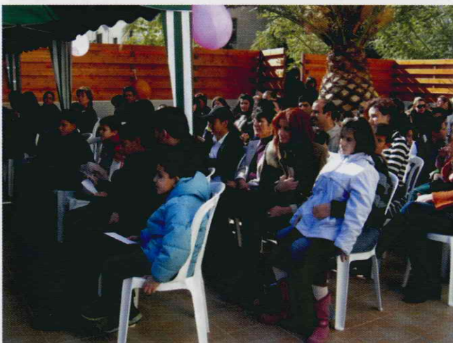
Στιγμιότυπο από την Πρωτοχρονιάτικη Γιορτή.