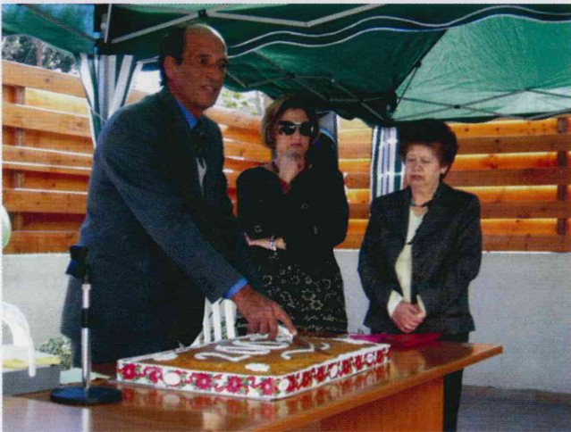
Το κόψιμο της Βασιλόπιπτας στις 30.12.2006