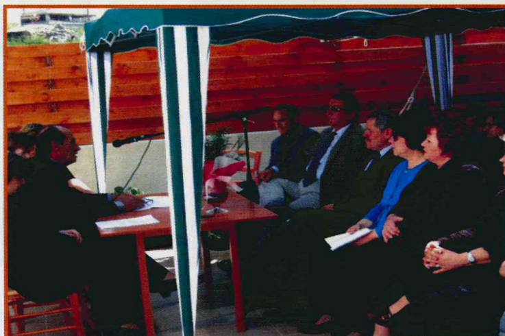
Ένα στιγμιότυπο από τη Γενική Συνέλευση

Όλες οι ενέργειές μας σε ένα κατατείνουν. Να μεταδώσουμε το μήνυμα στους ασθενείς μέλη μας ότι δεν είναι μόνοι. Υπάρχει συμπαράσταση από εθελοντές συνανθρώπους. Φιλοδοξία του Συνδέσμου είναι να μπορέσει κάτι να προσφέρει, συμβολικό μν, αλλά γεμάτο αγάπη.