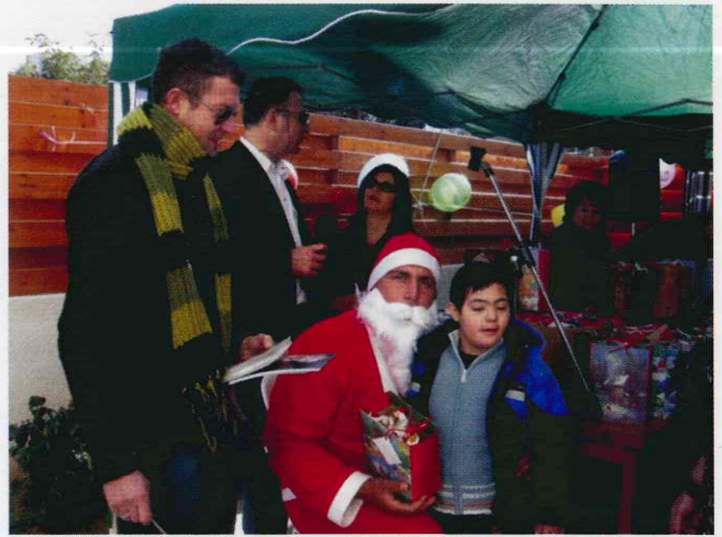
Στην Πρωτοχρονιάτικη γιορτή μας παρών και ο ηθοποιός Σοφοκλής Κασκαούνιας.