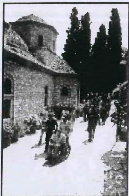
Εκδρομή στην Ελλάδα. Καλοκαίρι 2009

ΟΤΑΝ ΠΑΙΡΝΕΙΣ ΓΕΜΙΖΟΥΝ ΤΑ ΧΕΡΙΑ ΣΟΥ ΟΤΑΝ ΔΙΝΕΙΣ ΓΕΜΙΖΕΙ Η ΚΑΡΔΙΑ ΣΟΥ