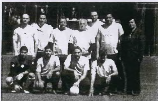
4ο τουρνουά ποδοσφαίρου ΣΑΛΑΣ.