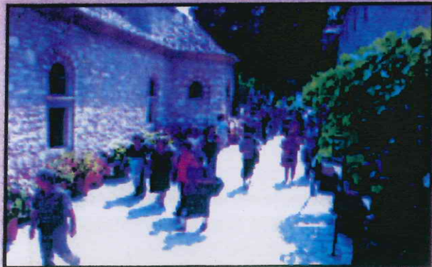
Μια ομάδα από τους εκδρομείς στην Έλλαδα

Για 7η κατά συνέχεια χρονιά ο Σύνδεσμος οργάνωσε εκδρομή στην Ελλάδα για τα μέλη του. Τα έξοδα των ασθενών - μελών τα κάλυψε εξ ολοκλήρου ο Σύνδεσμος. Το πρόγραμμα περιλάμβανε επίσκεψη στο Βόλο (3 διανυκτερεύσεις) με μονοήμερες εκδρομές στη Σκίαθο και στο Πήλιο. Ακολούθησαν 2 διανυκτερεύσεις στη Θεσσαλονίκη (ξενάγηση, ψώνια, και το βράδυ διασκέδαση στα Λαδάδικα). Μονοήμερη εκδρομή (τελευταία μέρα) στη Βεργίνα και στην Έδεσσα και επιστροφή στην Κύπρο. Στην εκδρομή πήραν μέρος 80 πρόσωπα (ασθενείς και συνοδοί). Όλα κύλησαν ομαλά χωρίς να παρουσιαστεί καμιά ΟΡΓΑΝΩΤΙΚΗ ανωμαλία (μια ώρα καθυστέρηση του αεροπλάνου από Θεσσαλονίκη για Λάρνακα δεν ήταν ευθύνη μας). Βέβαια είναι σύνηθες να ακούονται και παράπονα. Πέντε- έξι άτομα διαμαρτυρήθηκαν όχι για οργανωτικά θέματα αλλά για το πρόγραμμα. Πολλές οι ώρες στη Σκίαθο, δεν περιλάμβανε το πρόγραμμα περισσότερα προσκυνήματα. Η συντριπτική πλειοψηφία ευχαριστήθηκε και εξέφρασε την ικανοποίηση της στους υπεύθυνους με κάθε τρόπο. Βέβαια σε όλες τις Δράσεις του Συνδέσμου είναι δυνατό να υπάρξουν ατέλειες. Πάντοτε υπάρχει περιθώριο βελτίωσης. Αυτό δε μπορεί να το αρνηθεί κανένας. Εμείς στο Σύνδεσμο εργαζόμαστε δημοκρατικά και ομαδικά. Όλες οι δράσεις περνούν από το Συμβούλιο και ακολούθως αρχίζει η υλοποίηση τους. Έτσι και το πρόγραμμα της εκδρομής εγκρίθηκε ομόφωνα από το Συμβούλιο, στα χέρια των εκδρομέων ήταν (περιληπτικά από τον Μάιο) και λεπτομερώς από τα μέσα Ιουνίου.