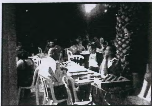
Στιγμιότυπα από τη διεξαγωγή παιγνιδιών - διαγωνισμών στην αυλή του Συνδέσμου