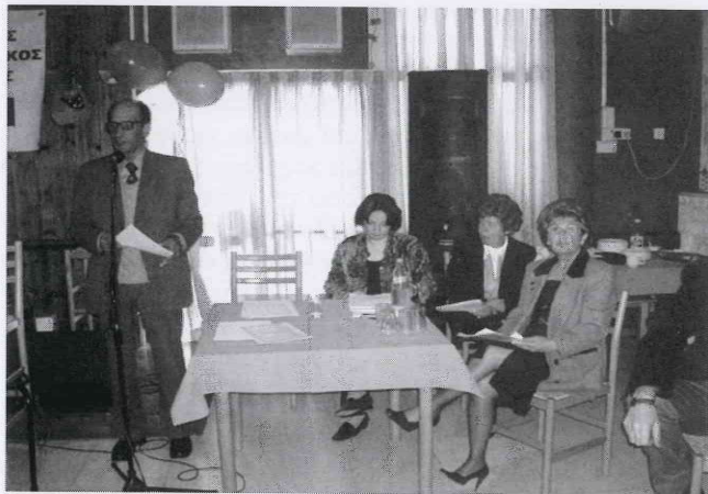
Ετήσια Γενική Συνέλευση 29/01/2006