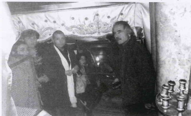
Από την επίσκεψή μας στο Ισραήλ 27/12/05

Εκεί συζήτησαν τα διάφορα προβλήματα που αντιμετωπίζουν στον Ξενώνα. Σκοπός αυτών των επισκέψεων αυτών είναι να νιώθουν οι πάσχοντες συνάνθρωποι μας ότι ο Σύνδεσμος είναι πάντα κοντά τους και τους συμπαραστέκεται σε κάθε τους δυσκολία. Η αντιπροσωπεία του Συνδέσμου συναντήθηκε με τους γιατρούς που περιθάλπουν τους ασθενείς και ενημερώθηκε για την υγεία