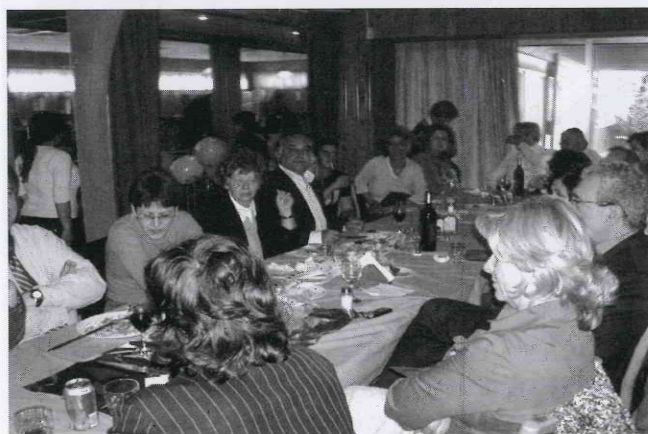
Μια παρέα στη συνεστίαση 29/01/2006

Κύριο χαρακτηριστικό της φετινής συνεστίαςης ήταν η ..... πίστα. Συνέχεια γεμάτη. Όλοι με κέφι και όρεξη.