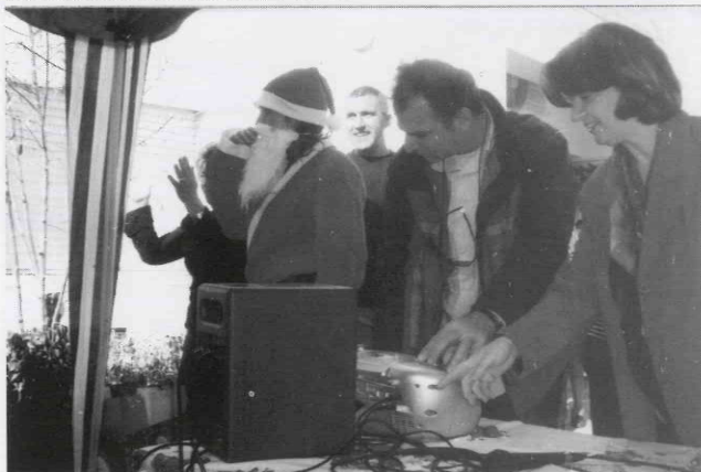
Από την πρωτοχρονιάτικη εκδήλωση.

Παράλληλα με τις Δράσεις, συνεχίστηκε η βοήθεια προς όσους είχαν ανάγκη. Το ποσό που δόθηκε ως οικονομική βοήθεια σε μέλη μας, ανήλθε στις £57.219. Επίσης δόθηκε ένα ποσό συνολικού ύψους £11.200 ως Χριστουγεννιάτικο επίδομα σε όλα τα ανήλικα παιδιά των ασθενών μελών μας, στα ασθενή παιδιά και φοιτητές. Με την ευκαιρία της μεταφοράς του Αιματολογικού Θαλάμου στο Νέο Γενικό Νοσοκομείο, ο Σύνδεσμος συνέβαλε στον εξοπλισμό του με ένα μηχάνημα - verna care 2000, 14 τραπεζάκια, 10 τηλεοράσεις και 1 DVD. Επίσης συνεχίζουμε να εφοδιάζουμε το θάλαμο με νερό για τις ανάγκες των ασθενών και άλλων.