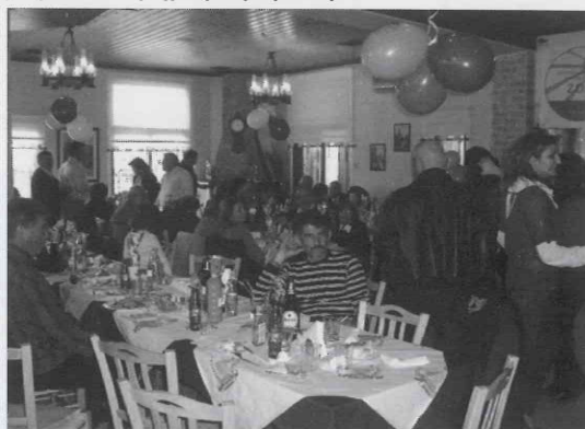
Μετά τη Συνέλευση ακολούθησε όπως πάντα συνεστίαση.

χριστουγεννιάτικων καρτών, και φυσικά στην οργάνωση και διεξαγωγή του οδικού εράνου σε όλες τις πόλεις της ελεύθερης Κύπρου, σε διαφορετικές ημερομηνίες.